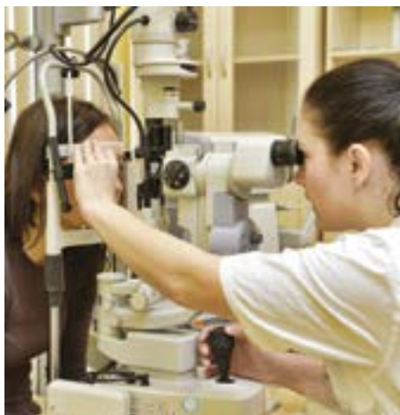
Popisek pod fotkou.

Ano, naše dětská ambulance se zaměřuje na veškeré oční problémy našich malých pacientů. Řešíme problémy vrozené neprůchodnosti slzných cest a jiných očních vrozených vad, léčíme děti šilhající a tupozraké, korigujeme refrakční vady.